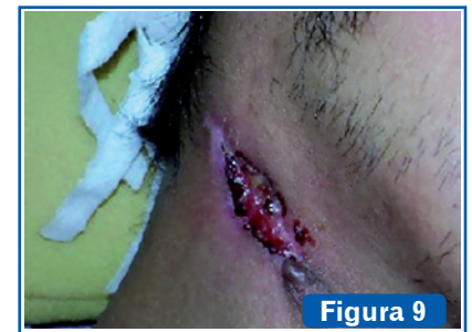
Tuberculosis en glándula parótida. Usualmente se limita a los nódulos linfáticos intra o extraparotídeos. Puede conducir a una escrófula con apertura en piel de cuello y formación de fístulas.