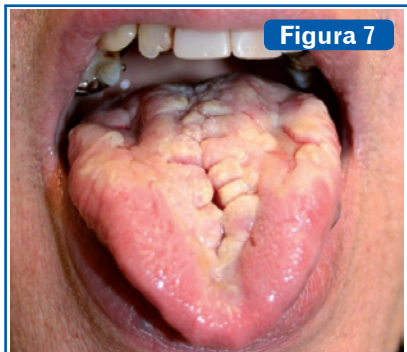
Lengua geográfica. También llamada glossitis migratoria benigna o glossitis exfoliativa. Se aprecian placas de color rojo, lisas, brillantes, con un epitelio adelgazado, las cuales no llegan a ulcerarse, sin papilas filiformes y en las que se destacan las papilas fungiformes, limitadas por una queratosis circundante sobre elevada de color blanco-amarillento (6).

la C tiene muchos rasgos en común con ella.