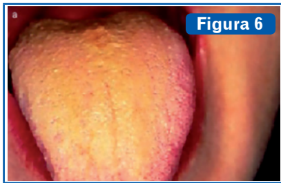
Ictericia. En primer lugar aparece en la esclera ocular, en segundo lugar en la región sublingual.