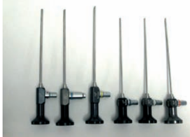
Ópticas rígidas con diferentes angulaciones para realizar endoscopia nasal

los ostium de los diferentes senos y hacer un diagnóstico mucho más preciso.