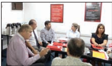
Comité Científico de Tendencias en Medicina, Encuentro Anual 2014, Asunción, Paraguay