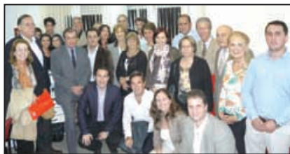
Comité Científico de Tendencias en Medicina, Encuentro Anual 2014, Montevideo, Uruguay