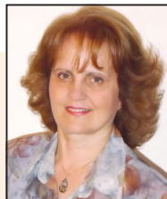
Médico Internista, Especialista en Medicina Familiar, Diabetóloga, Diabetóloga Infantil Ex Presidente de la Sociedad de Diabetología y Nutrición del Uruguay